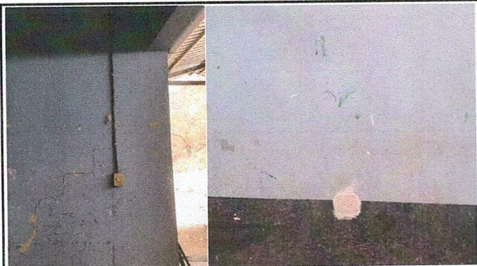
Foto1: CABLE, APAGADORES Y TOMACORRIENTES TODA LA INSTALACIÓN EN MAL ESTADO