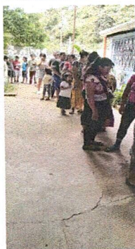
Foto 5: PATIO SIN TECHO DONDE SE REALIZAN DIVERSAS ACTIVIDADES ESCOLARES