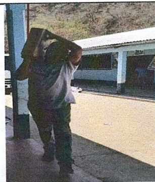
Foto 6: PATIO SIN TECHO DONDE SE REALIZAN DIVERSAS ACTIVIDADES ESCOLARES

Observación: Si es necesario se pueden agregar hojas adicionales actualizando el número de fotos.